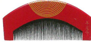
《渦巻文様時絵櫛》羊遊斎