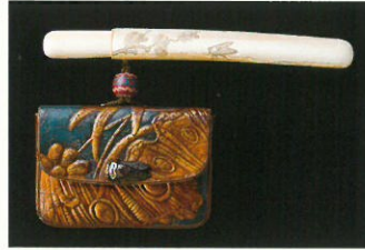
《金唐革腰差したばこ入れ》